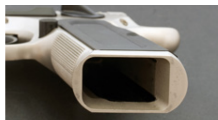
Inloppet till magasinbrunnen är fasat för att underlätta snabbt byte av magasin.

det, vilket gör att skytten griper vapnet närmare pipans kärnlinje – en klar ergonomisk fördel.