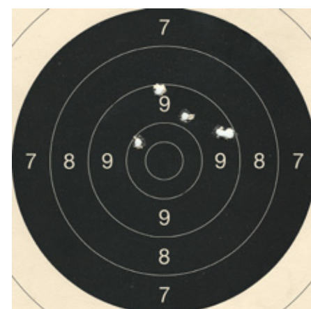
Träffbild med Alsa 8 grams FMJ (en tjeckisk handladdad ammunition).