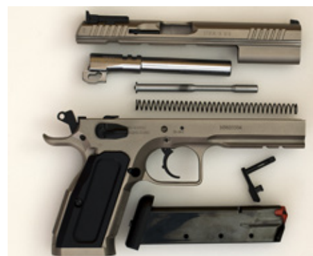
Tanfoglio Stock III tas isär på samma sätt som CZ 75.

Alla vapen med metallstomme har i stora drag behållit exteriören från CZ. Samma nära utseendemässiga samstämmighet gäller inte pistoler med polymerstomme. Dessa modeller - som av naturliga skäl