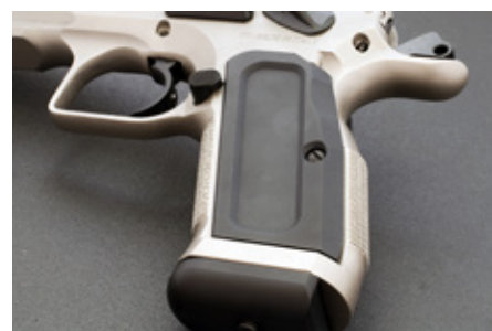
Tack vare tunna aluminiumplattor blir greppet något smalare än hos versioner med valnöts- eller syntetgrepp