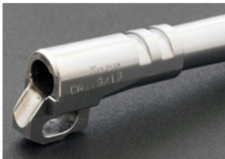
Pipan förreglas i manteln genom överliggande klackar, precis som hos CZ 75 och P210.