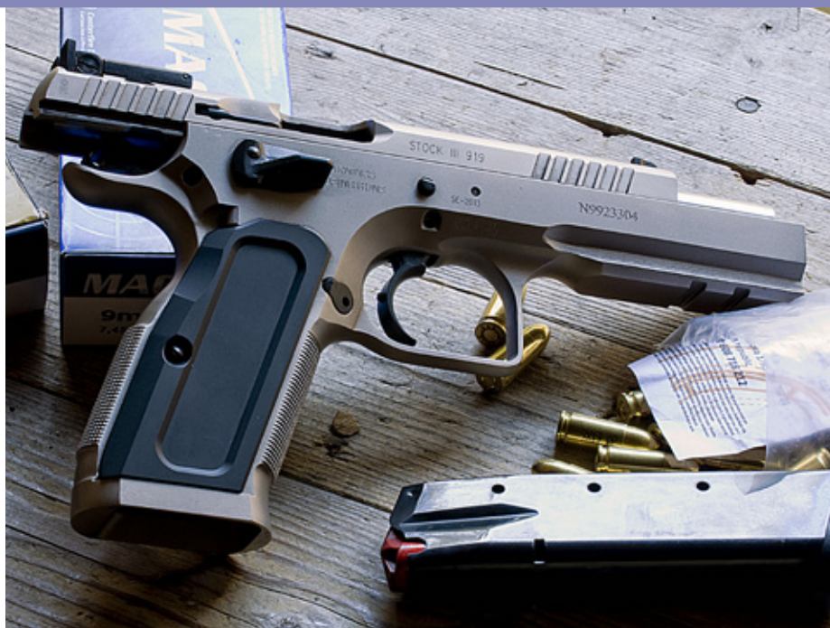
Tanfoglio Stock III provsköts på en skjutbana utomhus.