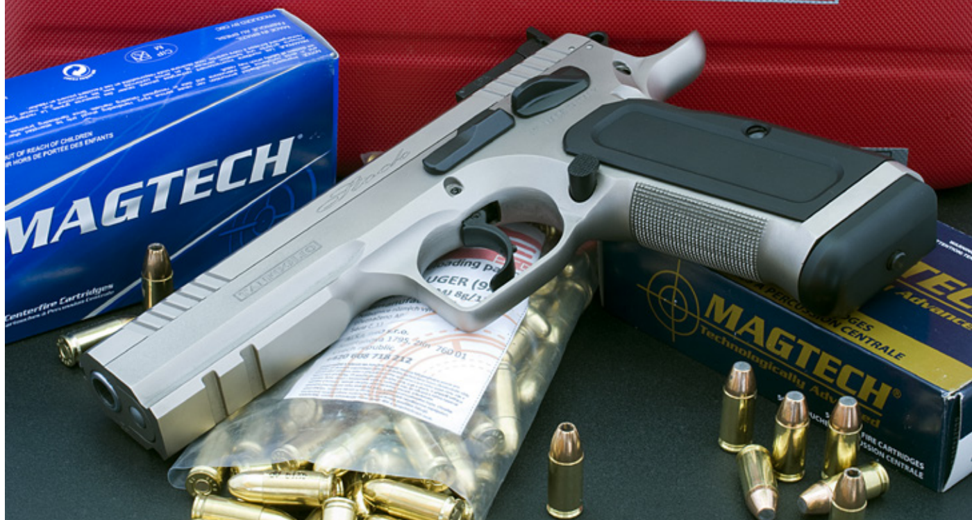
Tanfoglio Stock III