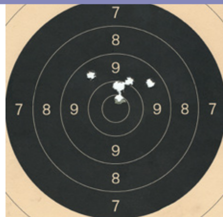
Träffbild med Sellier & Bellot 8 grams FMJ.

Författaren är pistolskytt och vapenskribent. Han är Hand&LuftvapenGuidens huvudskribent och faktaredaktör.