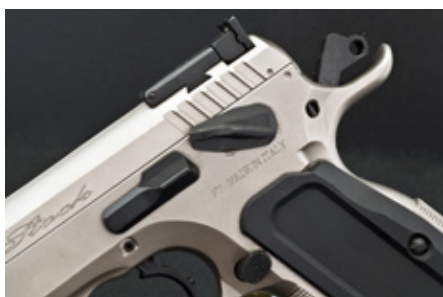
Bortsett från magasinsspärrens förlängda knapp har resten av reglagen normala mått och utformning. Tumveckskyddet är förlängt.