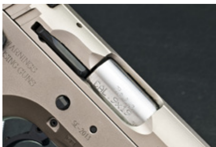
Utskärningar i utkastarporten för säkrare funktion.