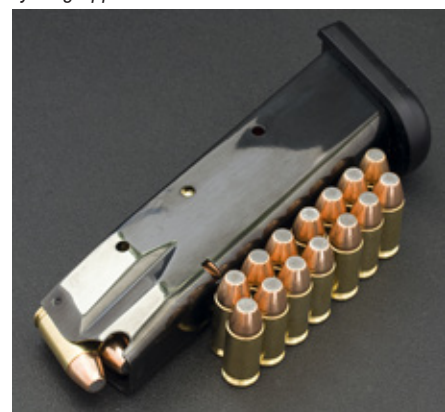
Magasinet som rymmer 14 patroner är försett med så kallad "bumper pad" i aluminium.